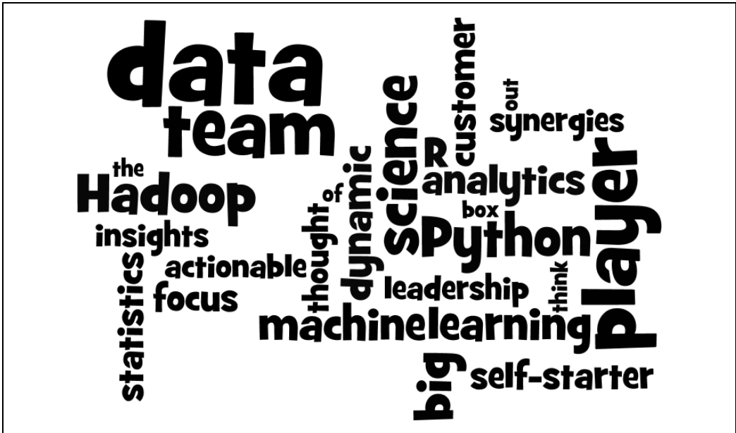
Rysunek 21.1. Chmura wyrazowa

Chmura wyrazowa wygląda ładnie, ale tak naprawdę przekazuje mało informacji. Ciekawszym rozwiązaniem byłoby umieszczenie wyrazów tak, aby położenie wyrazów w płaszczyźnie poziomej było zależne od częstotliwości ich występowania w ofertach pracy, a położenie w płaszczyźnie pionowej było zależne od częstotliwości ich występowania w życiorysach zawodowych. Z takiej wizualizacji można wyciągnąć więcej wniosków (zobacz rysunek 21.2):